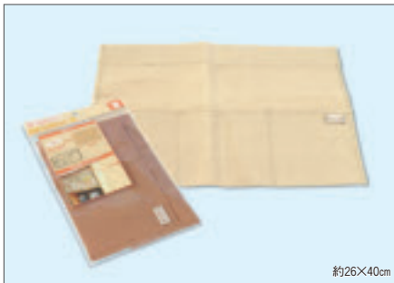
8324 めかくしポケット横(ヘッダー付)

入数12×箱数40/480 重量16.0kg C/S 480×330×420mm 原産国 C (表示有)