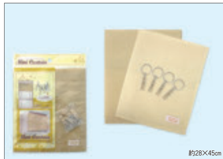
8327 めかくしカーテンナチュラル小(ヘッダー付)

入数12×箱数30/360 重量10.5kg C/S 360×270×430mm 原産国 C (表示有)