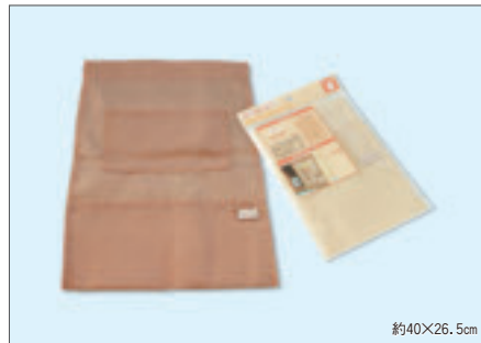
8325 めかくしポケット縦(ヘッダー付)

入数12×箱数40/480 重量17.0kg C/S 480×330×420mm 原産国 C (表示有)