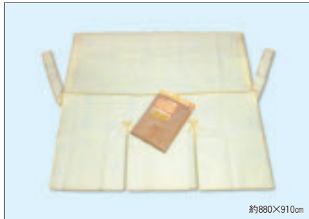
8329 3段ボックスめかくし横型(ヘッダー付)

入数12×箱数15/180 重量17.0kg C/S 760×370×400mm 原産国 C (表示有)