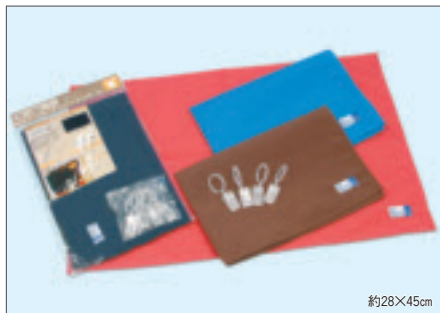
8336 めかくしカーテンベーシック小(ヘッダー付)

入数12×箱数30/360 重量13.5kg C/S 425×400×340mm 原産国 C (表示有)