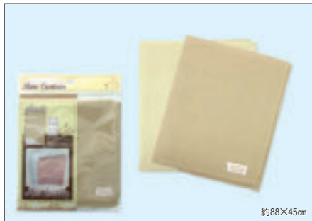
8328 めかくしカーテンナチュラル大(ヘッダー付)

入数12×箱数30/360 重量13.5kg C/S 540×420×295mm 原産国 C (表示有)