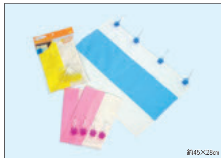
8321 めかくしカーテン(小)(ヘッダー付)

入数12×箱数30/360 重量17.0kg C/S 860×330×400mm 原産国 C (表示有)