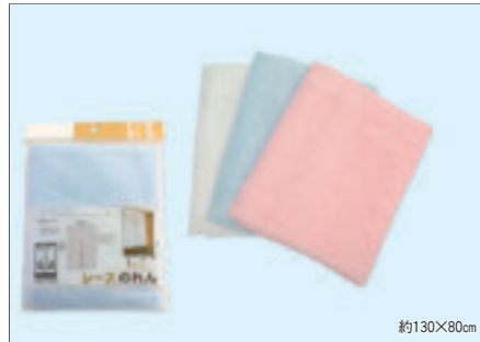
0165 レースのれん(ヘッダー付)

入数12×箱数20/240 重量18.0kg C/S 710×450×440mm 原産国 C (表示有)