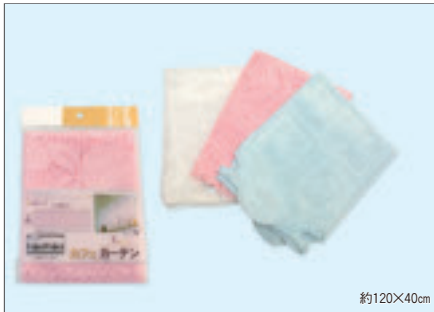
0156 カフェカーテン(ヘッダー付)

入数12×箱数30/360 重量17.0kg C/S 650×345×470mm 原産国 C (表示有)