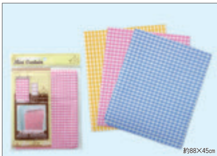
8335 めかくしカーテンチェック大(ヘッダー付)

入数12×箱数30/360 重量16.0kg C/S 560×220×400mm 原産国 C (表示有)