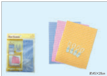
8334 めかくしカーテンチェック小(ヘッダー付)

入数12×箱数30/360 重量11.0kg C/S 815×310×280mm 原産国 C (表示有)