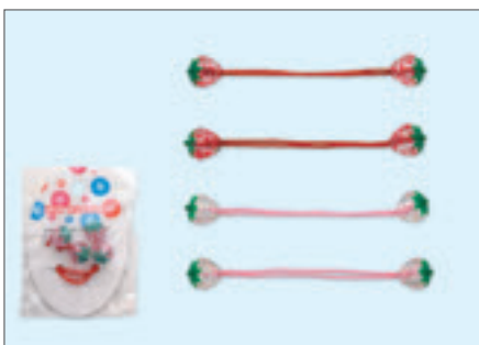
2202-45 クリスタルイチゴ(紙台紙袋入)

入数12×箱数50/600 重量4.0kg C/S 510×315×200mm 原産国 C (表示有)