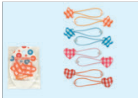
2202-146 タータンチェックポニー/2P(紙台紙袋入)

入数12×箱数50/600 重量4.0kg C/S 510×315×200mm 原産国 C (表示有)