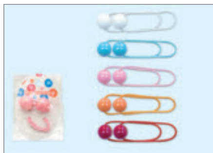
2202-137 ボールポニー/2P(紙台紙袋入)

入数12×箱数50/600 重量8.0kg C/S 510×315×200mm 原産国 C (表示有)