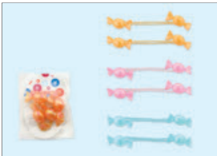
2202-148 カラフルキャンディポニー/2P(紙台紙袋入)

入数12×箱数50/600 重量6.0kg C/S 510×315×200mm 原産国 C (表示有)